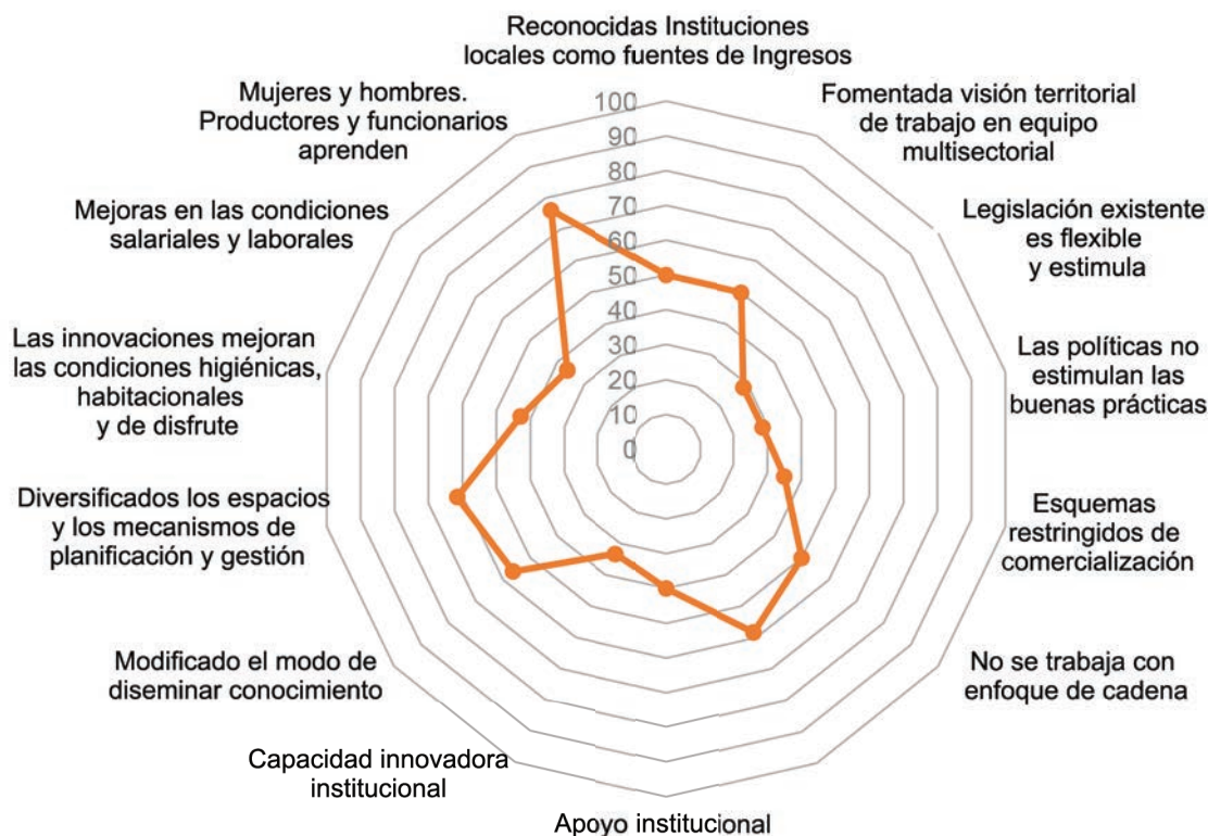
Figura 3. Patrones de respuesta de variables en la dimensión cultural asociativa. Eje de innovación.

diferente, a contar con la ciencia, a unir a todos... y esta es una vía factible para lograr resultados».